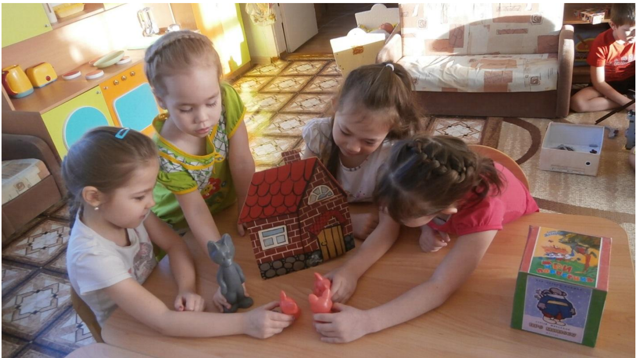
Стихи Сергея Михалкова мы читали